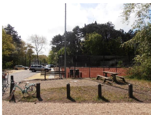
Plantvak te klein Beschutting picknickplaats weg Dichte bestrating belemmert begroeiing Landschappelijk verrommeling