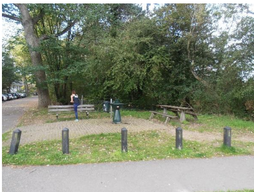
Beschut picknick plaatsje Visuele afscherming